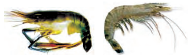
मेक्रोब्रेकियम रोजेन वर्गी (ताज़ा पानी) पीनस मोनडोन (समुद्री)

भविष्य में समुद्री मछलियों का भंडार (stock) कम होने की अवस्था में इन मछलियों की पूर्ति संवर्धन के द्वारा हो सकती है। इस प्रणाली को समुद्री संवर्धन (मेरीकल्चर) कहते हैं।